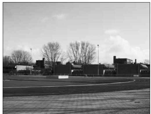
Pal achter de Nutsschool (rechts) bevindt zich een aantal gebouwtjes dat bij het HALO-complex hoort, met onder meer een gymlokaal, kleedruimten, een materiaalruimte en het fitness/wellnesscentrum. Links op de foto staat achter de Montessorischool een sporthal Halo die de beide scholen graag willen (blijven) gebruiken.

Ondanks de nog bestaande mogelijkheden tot schuiven en puzzelen is het echter zo klaar als een klontje dat de gemeente in alle varianten het speelveldje benut. In een van de schetsen staan bijvoorbeeld op dit veld slechts zeven eengezinswoningen gepland en op het HALO-terrein (met behoud van het fitnesscentrum en de tennisbanen) twintig appartementen en vier villaatjes. Maar dan gaat de gemeente niet voor drie maar voor ruim zes miljoen het schip in. Bouw je echter op de twee locaties in totaal 56 appartementen en 13 eengezinswoningen, dan