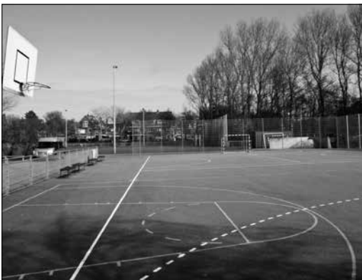
Achter de Montessorischool ligt een geasfalteerd oefenterreintje voor onder meer basketbal en handbal. Verderop bevindt zich een trainingsgrasveld voor voetbal, dat wordt begrensd door de kantine van Haag Atletiek, de Laan van Poot en het kinderspeelveldje waarop woningen zijn geprojecteerd.

Een aantal wijkbewoners uitte tijdens de bijeenkomst de vrees dat eventuele bebouwing van het speelweide de opmaat zal zijn tot meer woningbouw langs de duinrand. „De gemeente zal er een precedent in zien om steeds meer