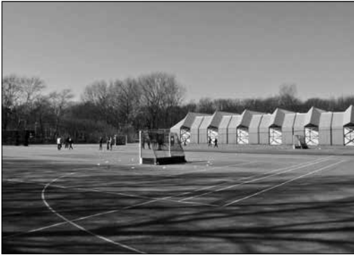
De multifunctionele sporthal van handbalvereniging Hellas met op de voorgrond de HALO-kunstgras tennisbanen, die soms ook - zoals op de foto - voor andere sporten worden gebruikt.

speelt de gemeente bijna quitte. Maar op de informatieavond haalden veel aanwezigen hun schouders op over de financiële rekenarij en de voorspelde exploitatieverliezen. „Dat is hun probleem, niet het onze”, was in de wandelgangen vaak te horen.